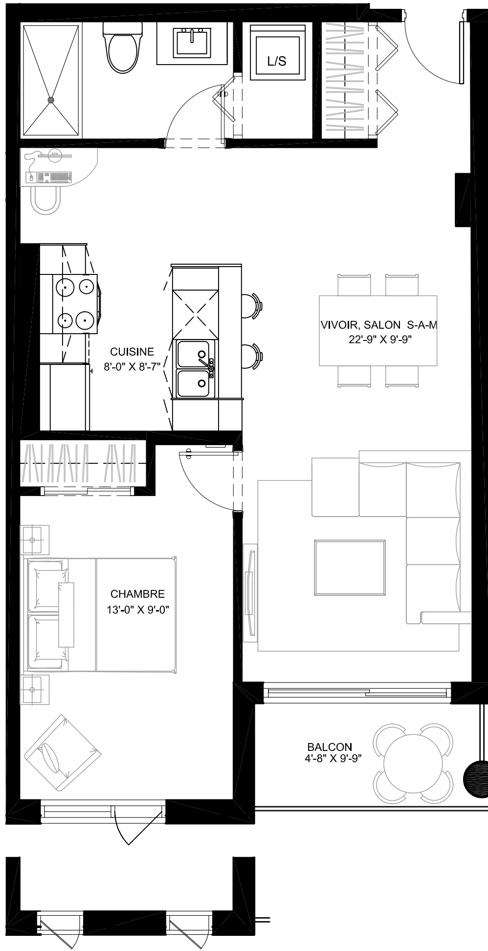
FAÇADE ALTERNATIVE ÉTAGES 3, 5 ET 7