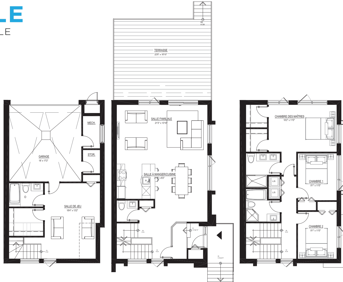
S.S. (865pi 2 )

NOTE La superficie brute et les dimensions de pièces montrées sur les plans sont approximatives et peuvent varier. La superficie est calculée à la face extérieure des murs extérieurs et au centre des cloisons mitoyennes et des corridors communs.